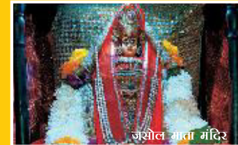
जसोल माता मंदिर