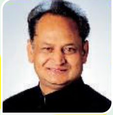
श्री अशोक गहलोत मुख्य मंत्री, राजस्थान