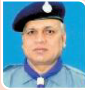
निरंजन आर्य राज्य मुख्य आयुक्त भारत स्काउट व गाइड, राजस्थान राज्य एवं जम्बूरी महासचिव